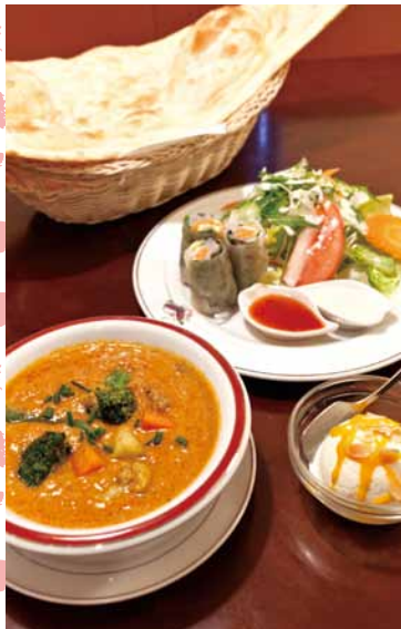
レディースセット ¥1,490 ナンorライス、カレー(チョイスメニューより1つ選択)、サラダ、生春巻き、デザート

075-213-7919 http://www.yakandyeti.co.jp/