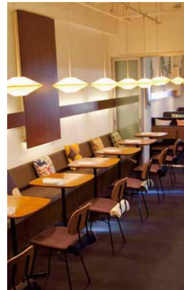
天然酵母の自家製パンが食べ放題になるランチとディナーが大人気のほっこりカフェ。

075-213-1610 http://www.boogaloo cafe.co.jp