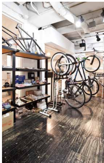
ビスト初心者から乗りなれた方まで、幅広く乗れる1台がそろっています。