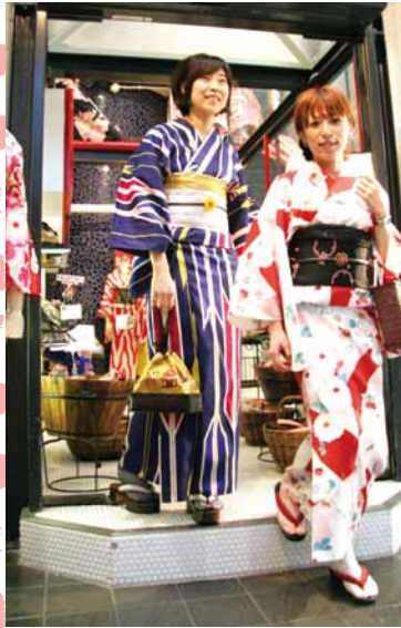
レンタルしても買っても直ぐに着付けてお出掛けできます♪ 成人式振袖レンタル ¥12,600～