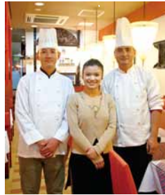
ランチ A セット ¥750 カレー(チキン or 野菜 or 日替わり) サラダ アチャール(ネパールのお漬物) ライス ナン