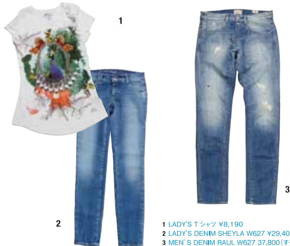
1 LADY'S T シャツ ¥8,190 2 LADY'S DENIM SHEYLA W627 ¥29,400 3 MEN'S DENIM RAUL W627 ¥37,800(すべて GAS)