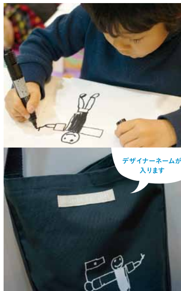
お絵かき中(上) デザイナーがお子さまの絵を元に校正し2週間〜3週間後に 出来上がり。(下)