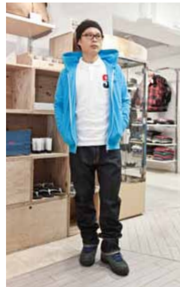
NEON ICON ZIP HOODIE ¥13,440 BIG S POLO ¥9,240 DEEP JEAN ¥13,440(すべてSTUSSY)

旧き佳きカリフォルニアに思いを馳せるポップ&カジュアルな STUSSYの SPRINGライン。