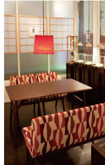
ゆったりくつろげるカフェのようなスペース。