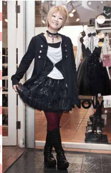
ナホレオンバレーンパーカー ¥14,490、レイヤード風カットソー ¥9,450、 ヒョウ柄チュールスカート ¥15,540(すべてBPN GLITTER)