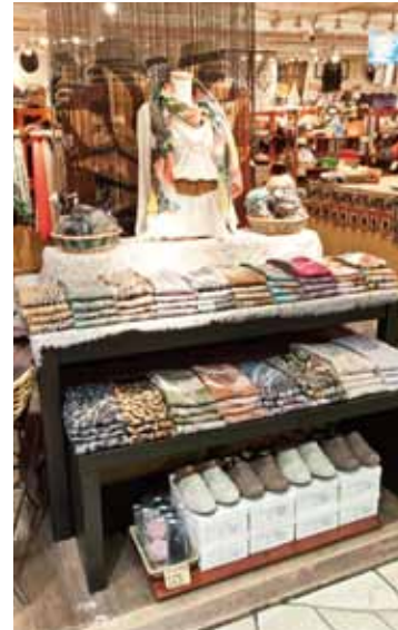
リーズナブルな価格で新商品も展開中!