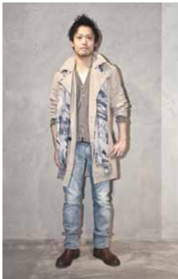
トレンチコート ¥37,800、カーディガン ¥16,800 デニム ¥23,100、ストール ¥12,600(すべてGAS)

GAS はイタリアのデニムブランドです。GAS のデニムの履き心地はとても柔らかく、ストレスフリーなデニムとなっております。ぜひ一度お試しください。