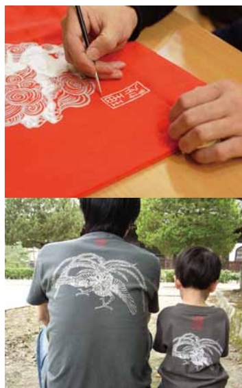
篆刻文字で名入れ中。(上) 親子でお揃い、ギフトにも最適です。(下)