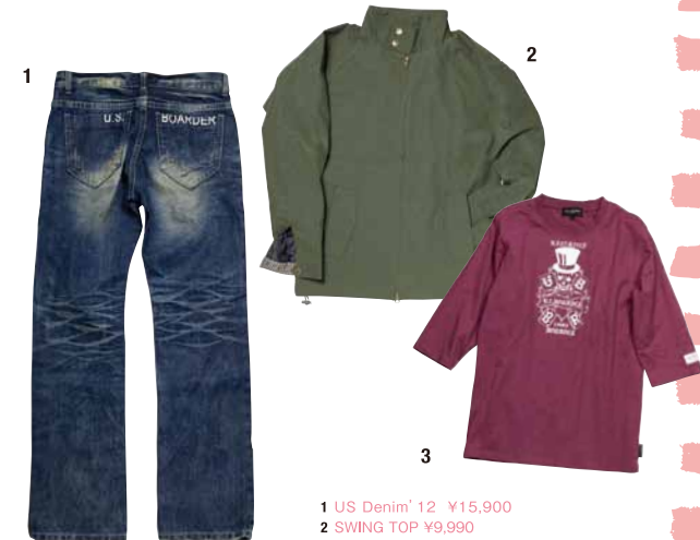
1 US Denim' 12 ¥15,900 2 SWING TOP ¥9,990 3 7/S tee ¥5,990(すべて U.S.BOARDER)

アーバンウェアの独特な素材感や風合いを大切に。着心地の良さを極めた商品開発を探索しています。オリジナルブランドならではのデザインとプライスが魅力的です。