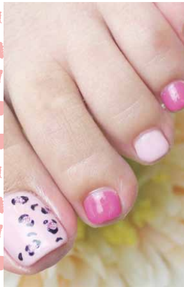
カラー1色塗り+ヒョウ柄(1本)+1カラープラス ¥6,300

075-223-2348 www.everydaysunday.jp/speednail-kyoto.html